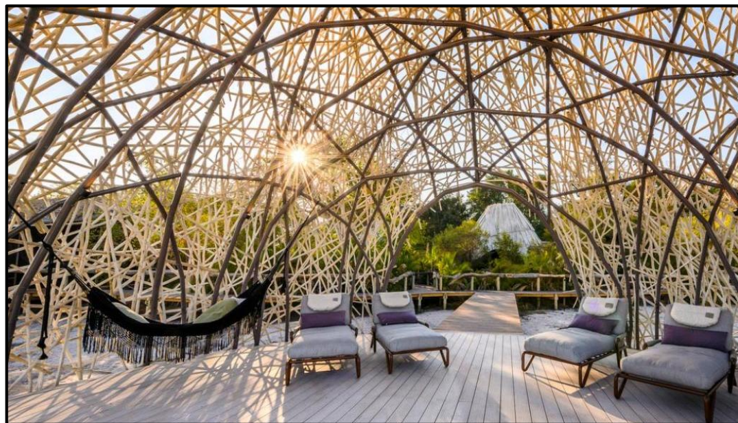
FIGUUR K: Voëlnes('Bird's Nest')-swembadtuinhuisie (’n buitelog-struktuur wat skadu teen die son verskaf en vir buitelogonthaal gebruik kan word), Jao Kamp Okavango Delta-lodge (Botswana), 2022.

5.2.1 Verduidelik die rol wat Inheemse Kunshandwerk-tegnieke in die Suid-Afrikaanse toerismebedryf kan speel met verwysing na die ontwerp in FIGUUR K hierbo. (2)