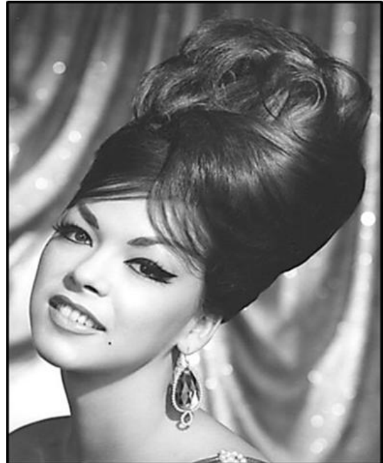
FIGUUR E: Modieuse byekorfhaarsstyl (VSA), 1960's.

Skryf 'n paragraaf waarin jy die haarstylontwerpe in FIGUUR D en FIGUUR E vergelyk met verwysing na die volgende: