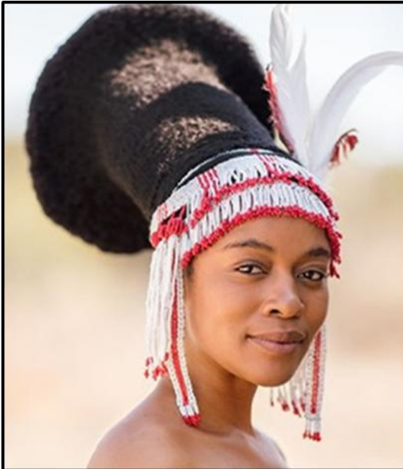
FIGUUR D: Tradisionele amaZulu-haarstyl (Suid-Afrika), 2022.