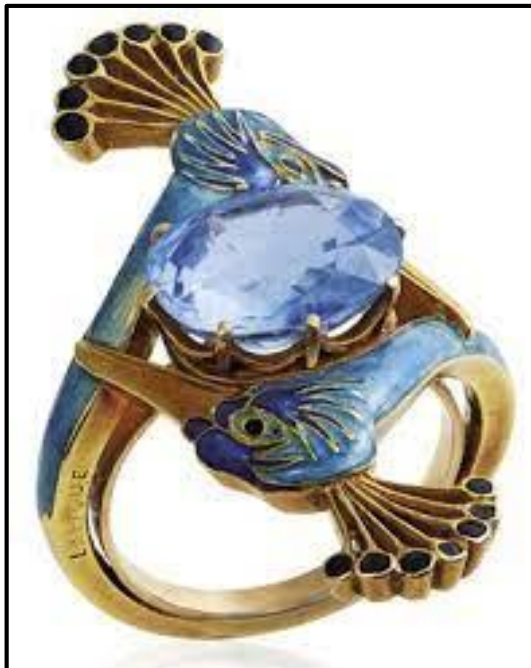
FIGUUR I: Art Nouveau-ring deur René Lalique (Frankryk), circa 1900.

Skryf 'n opstel (ten minste EEN bladsy) waarin jy die ringe in FIGUUR H en FIGUUR I hierbo vergelyk en verduidelik hoe hulle tipies is van die bewegings wat hulle verteenwoordig.