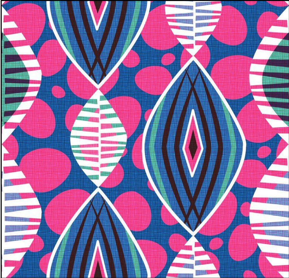
FIGUUR A: Tekstielontwerp ter ere van Swart Geskiedenis-maand ('Black History Month') deur Spoonflower (VSA), 2020.

1.1.1 Analiseer die gebruik van die volgende elemente en beginsel in FIGUUR A hierbo: