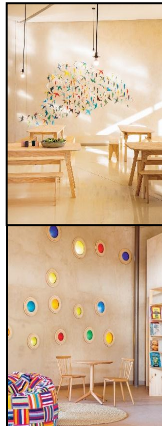
FIGUUR 8c: Binne-aansigte van die skool.