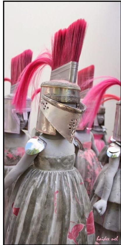
FIGUUR 7a en 7b (detail): Haidee Nel, Infantry Children/Kaalvoetsoldate (Barefoot Soldiers) , beeldhou-installasie, gemengde media (sement, plastiek, metaal, kwasse en marmer), 2015.