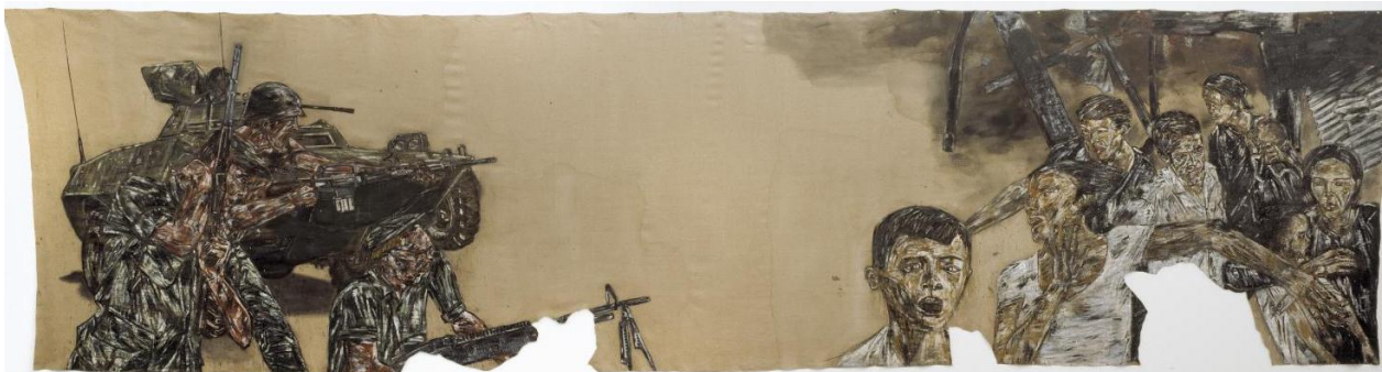
FIGUUR 3b: Leon Golub, Vietnam II (Viëtnam II) , akriel op doek, 1973.