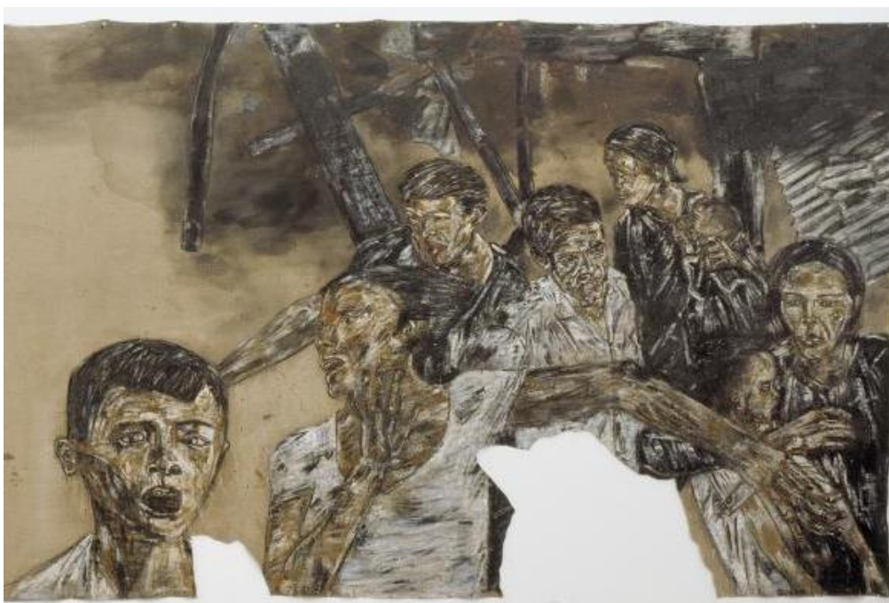
FIGUUR 3c: Leon Golub, Vietnam II (detail) (Viëtnam II) , akriel op doek, 1973.