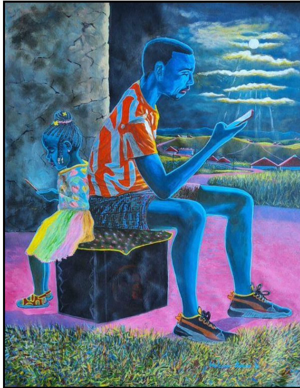
FIGUUR 6a: Welcome Danca, So Near and Yet So Far (So Naby en Tog So Ver) , olie en akriel op doek, 2021.