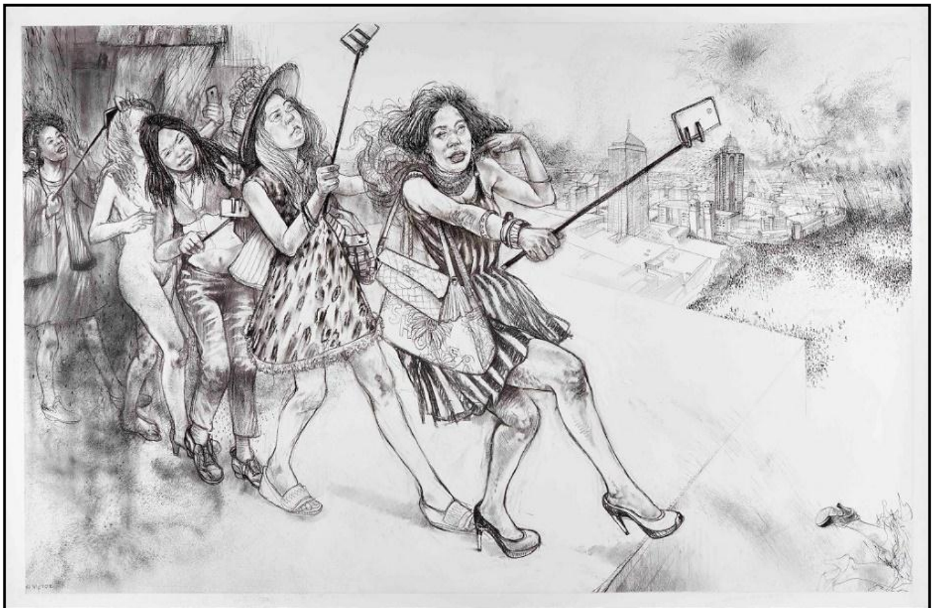
FIGUUR 6b: Diane Victor, The Parable of the Selfie and the Self-perpetuating Problem (Die Gelykenis van die Selfie en die Oneindige Probleem) , houtskool, pastel en as op papier, 2015.