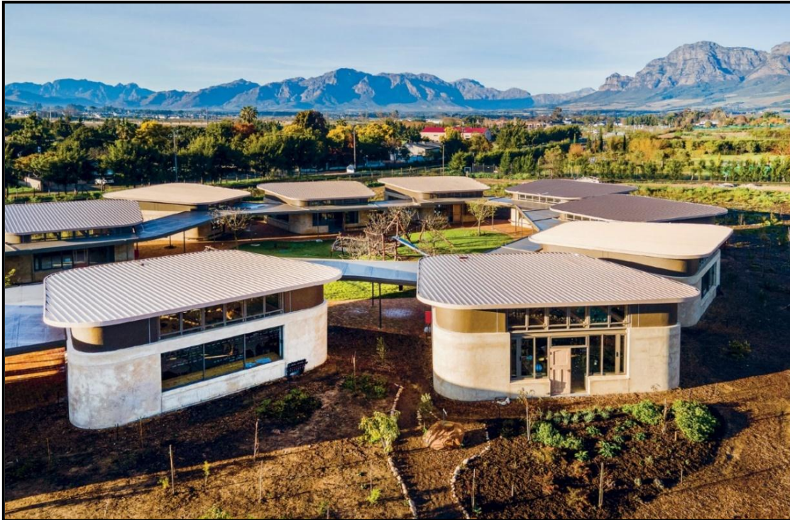
FIGUUR 8a: Fabio Venturi (Terramanzi Group), Green School South Africa (Groen Skool Suid-Afrika) (GSSA) , Paarl (Wes-Kaap), beton en herwinde materiale, 2022.