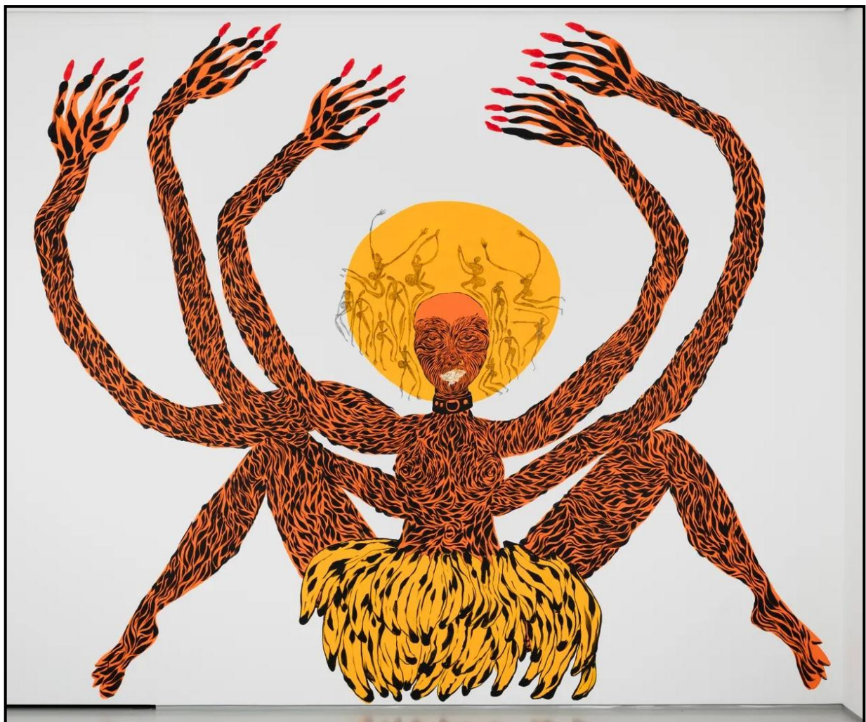
FIGUUR 2b: Lady Skollie, Lust Politics (Welluspolitiek) , muurskildery, 2017.