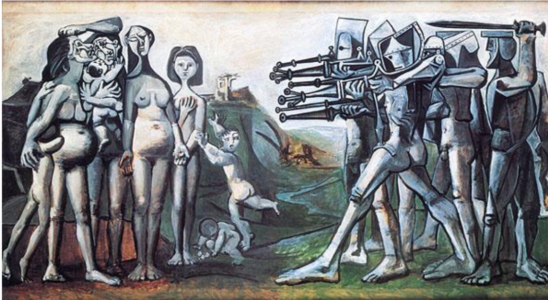
FIGUUR 3a: Pablo Picasso, Massacre in Korea (Slagting in Korea) , olie op doek, 1951.