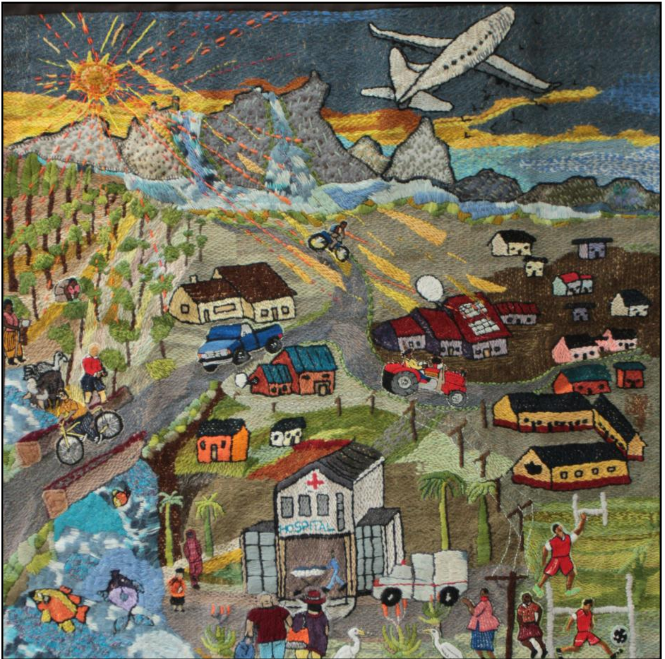
FIGUUR 4: Siyabonga Maswana en Sanela Maxengana (Keiskamma Kunsprojek), Our Vision for Africa (Ons Visie vir Afrika) , tapisserie, 2020.