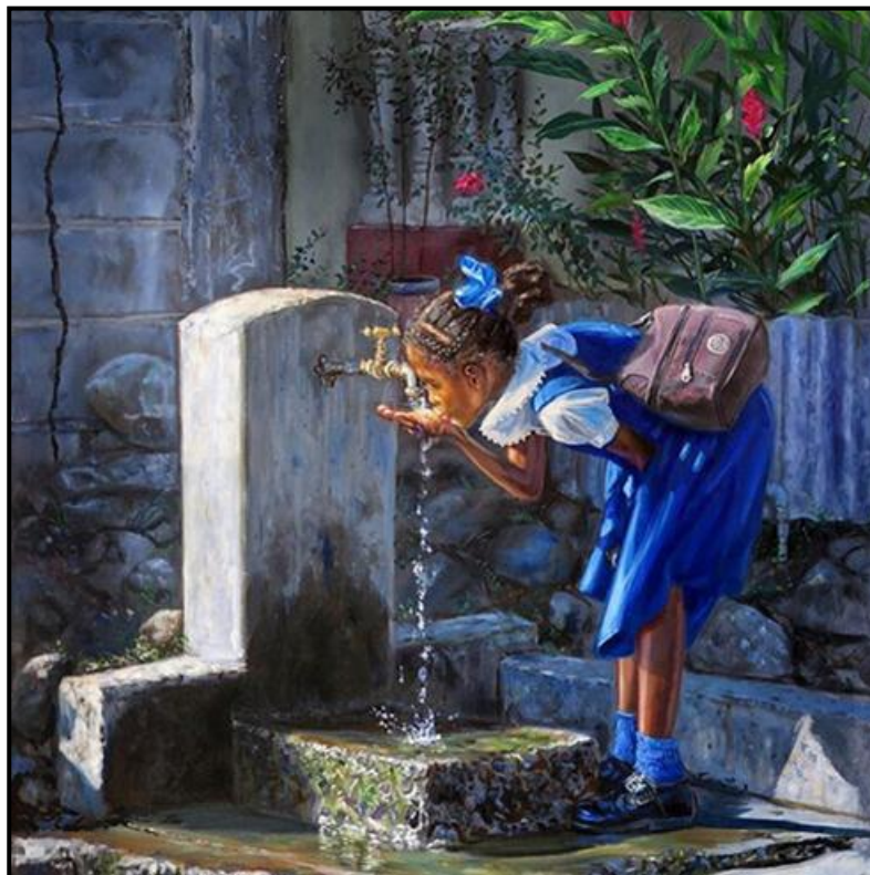
FIGUUR 1b: Jonathan Guy-Gladding, Stand Pipe #3 (Standpyp #3) , olie op doek, c. 2019.