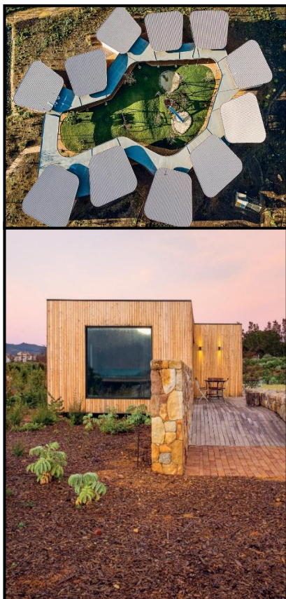
FIGUUR 8b: Die boonste foto dui 'n lugaansig op die skool aan. Die onderste foto toon die groot vensters wat verseker dat die skool se tuine uit al die klaskamers en ander geboue sigbaar is.