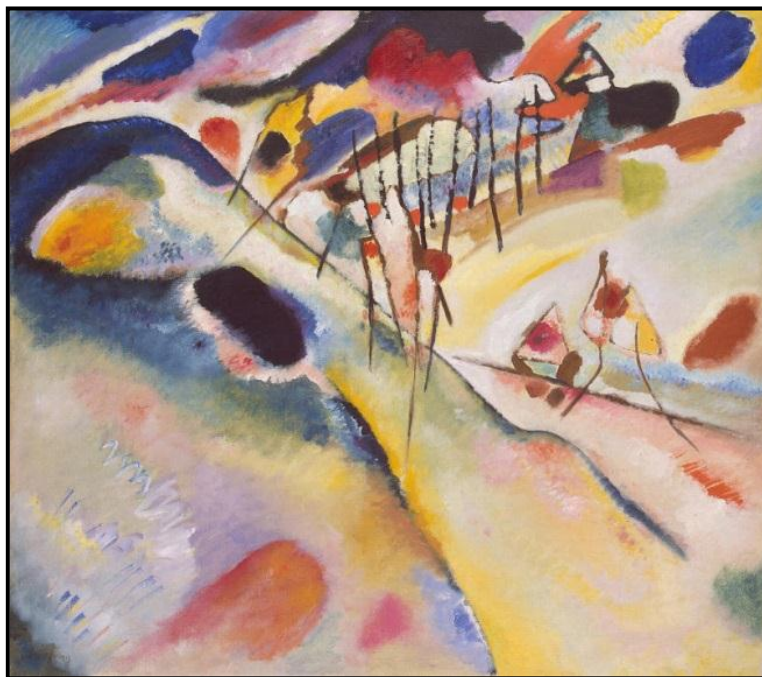
FIGUUR 3: Wassily Kandinsky, Landskap , olie op doek, 1913. Hy het die natuur as vertrekpunt vir sy skilderye, wat op die geestelike in kuns gefokus het, gebruik.