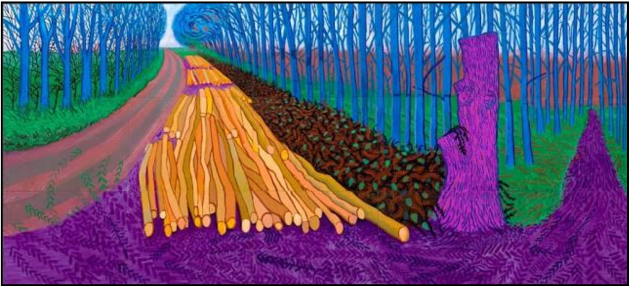
FIGUUR 4: David Hockney, iPad-digitale kunswerk, 2020.