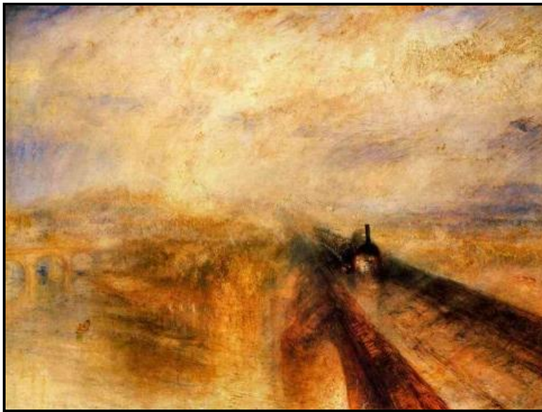
FIGUUR 2: William Turner, Reën, Stoom en Speed – Die Groot Westerse Spoorlyn (' Rain, Steam and Speed – The Great Western Railway '), olie op doek, 1844.

Kunstenaars word oor die eeue heen deur die uitbeelding van die natuur en landskappe gefassineer.