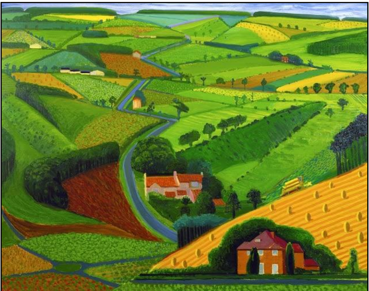
FIGUUR 5: David Hockney, 'n Groter Prentjie , iPad-digitale kunswerk, 2020. Hockney het verskeie iPad-tekeninge en plein air van die oostelike Yorkshire-landskappe gemaak wat die oorgang van winter na somer wys.