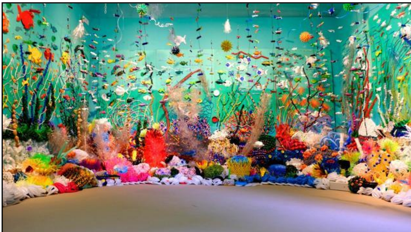
FIGURE 9: Federico Uribe se Persoonlike Struik , 2019, is deur bewaring en plastiekbesoedeling geïnspireer. Uribe het ongewone voorwerpe en materiaal, soos patroondoppies, gekleurde skoenvels, spelde, potlode, elektriese drade, dasse en boeke hergebruik om 'n koraalrifinstallasie te skep. Op 'n afstand lyk die assemblages soos 'n mooi, kleurvolle onderwaterwêreld, wat ons aan die broosheid van die lewe herinner. Die vervaardiging van plastiek is onomkeerbaar en volgens die Wêreld Ekonomiese Forum produseer die wêreld nou meer as 300 miljoen ton plastiek elke jaar. Slegs 40 persent word een keer gebruik en meer as 8 miljoen ton plastiek word jaarliks in die see gestort.