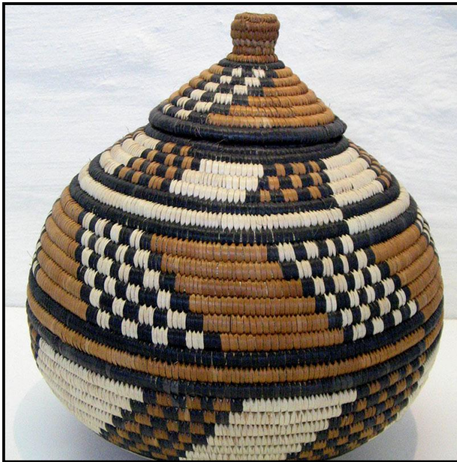
FIGUUR 4a: Die Afrika-kunssentrum, Ilalapalm-mandjies , palm, gras en kleursel (gemaak om Zoeloe-bier in te stoor), datum onbekend.