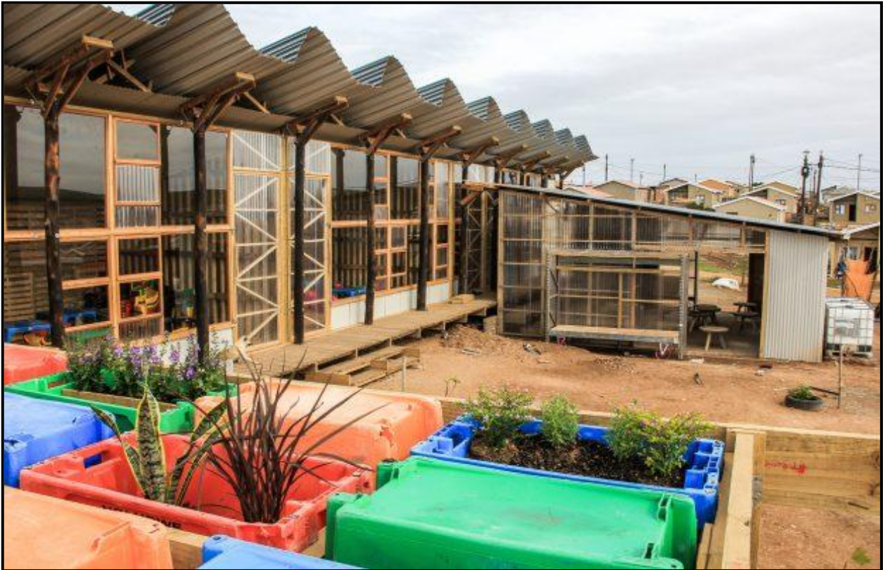
FIGUUR 8a: Collectif Saga, Silindokuhle Preschool , Port Elizabeth, Suid-Afrika, 2018.