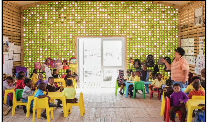
FIGUUR 8c: Collectif Saga, 'n blik op die interieur van die klaskamer.