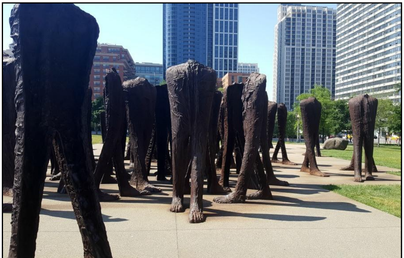
FIGUUR 5b: Magdalena Abakanowicz, Agora , gietyster, Grant Park, Chicago, VSA, 2016.