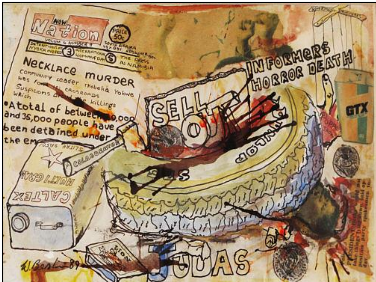
FIGUUR 3a: Willie Bester, Necklace Murder (Halssnoermoord) , ink-was-collage, 1989.