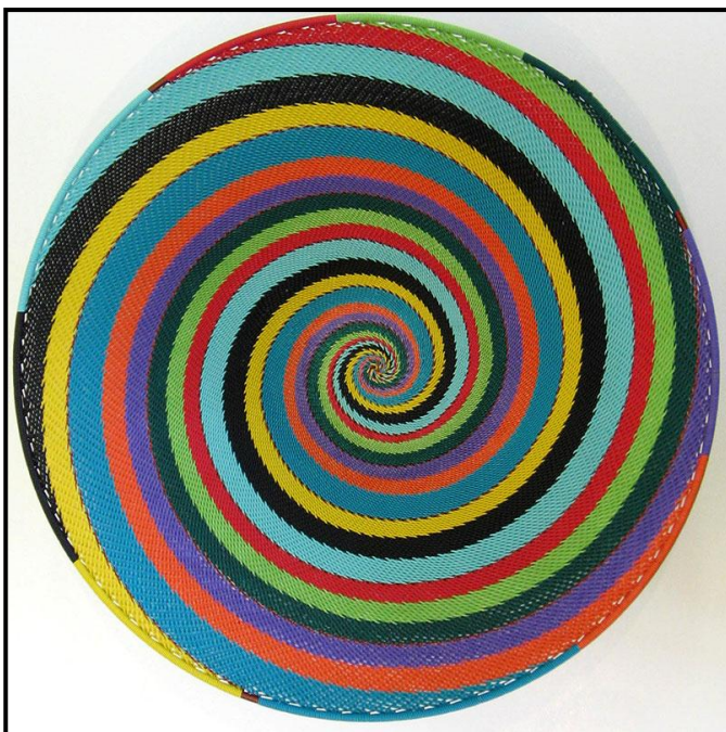
FIGUUR 4c: Die Afrika-kunssentrum, Telefoondraadmandjiewerk , draad. Hierdie vlyt het waarskynlik sy oorsprong in die 1950's in KwaZulu-Natal gehad.