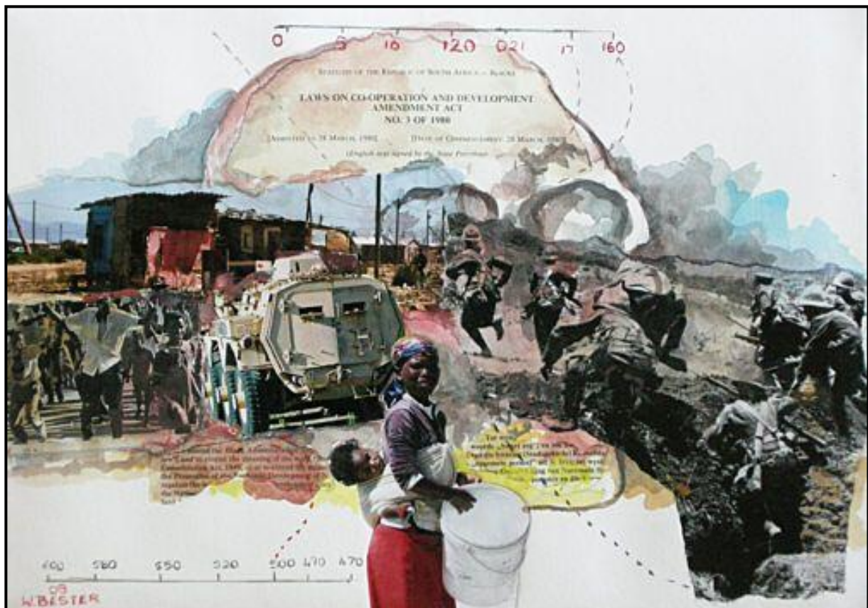
FIGUUR 3b: Willie Bester, Laws on Co-operation and Development II (Wette oor Samewerking en Ontwikkeling II) , waterverf en collage, 2009.