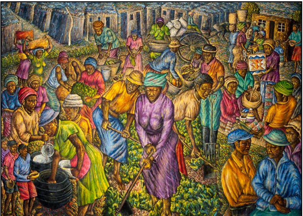
FIGUUR 1b: Helen Sebidi, The Dispossessed (Die Onteiendes) , akrielverf op doek, 2011.