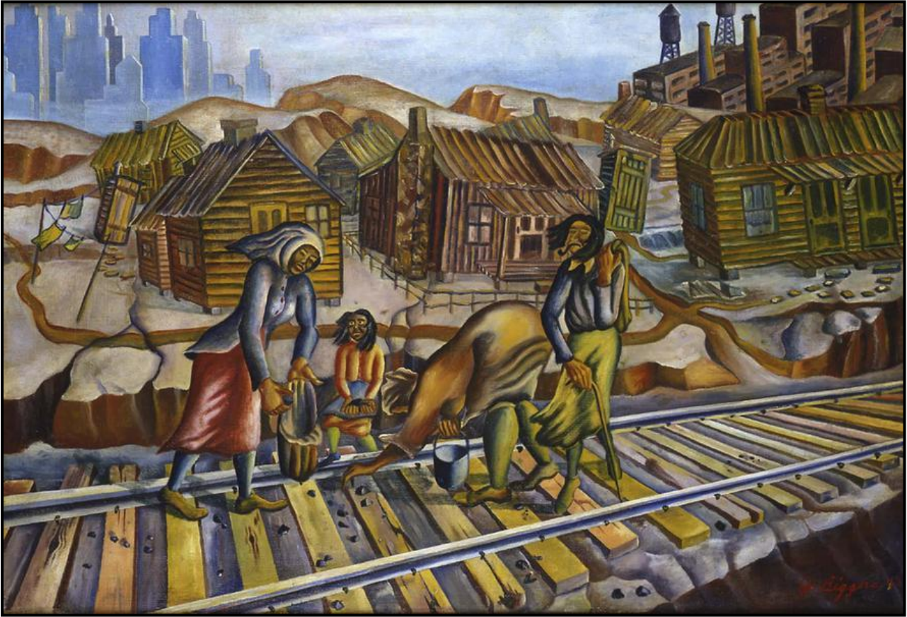
FIGUUR 1a: John Biggers, The Gleaners (Die Versamelaars) , olie op doek, 1943.