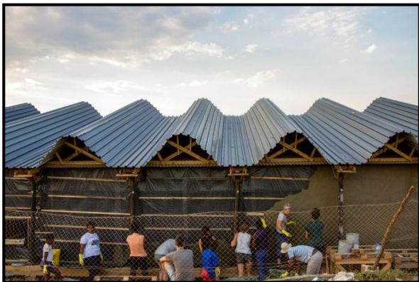
FIGUUR 8b: Collectif Saga, bouproses van Silindokuhle Preschool .