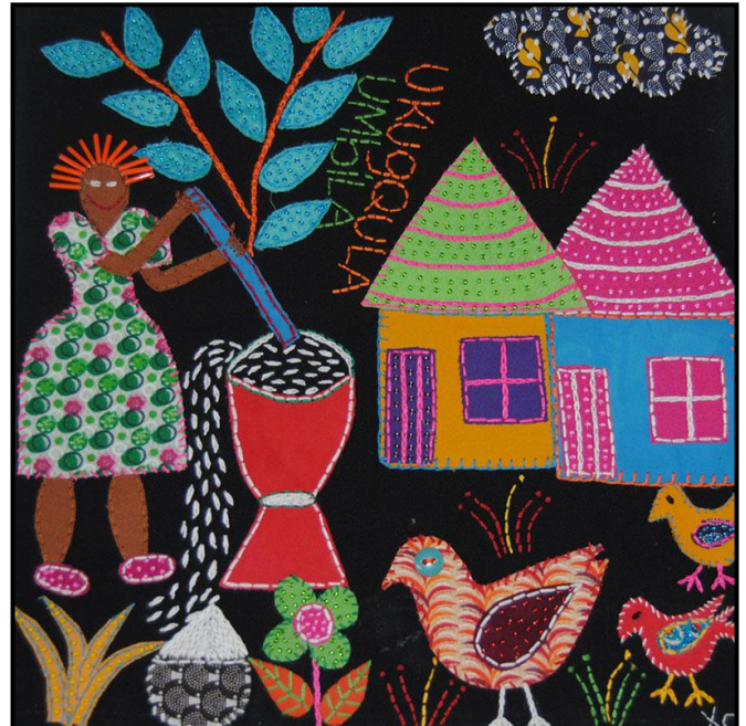
FIGUUR 4b: Die Afrika-kunssentrum, Appliek (geborduurde paneel) van Ukugqula Umbila (stamp van mielies/koring) deur die Ntokozo-groep, 2004.