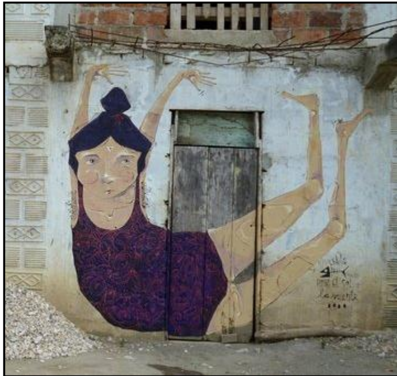
FIGUUR 7a: La Suerte, titel onbekend , muurskildery in 'n agterbuurt, 2015.