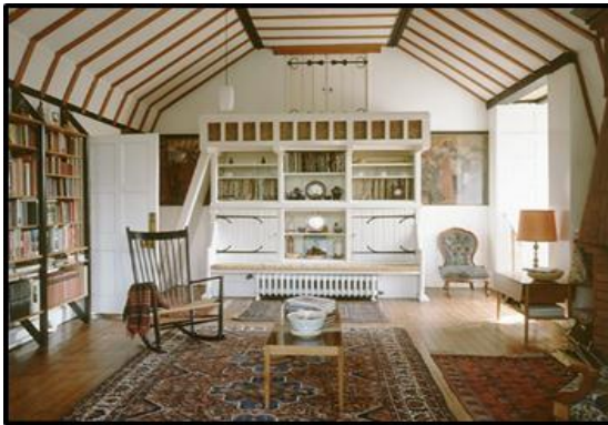
Kuns en Kunsvlyt