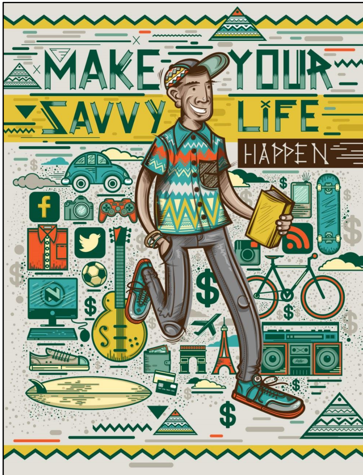
Identifiseer en bespreek TWEE simbole wat in FIGUUR C hierbo gebruik word en verduidelik die moontlike betekenisse daarvan met betrekking tot die boodskap van die plakkaat.