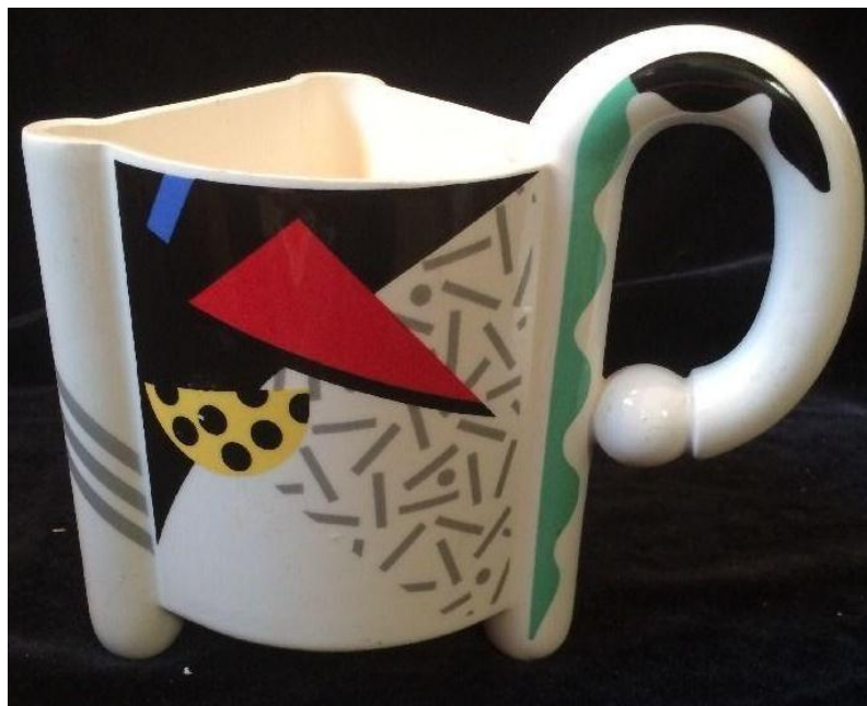
FIGUUR E: Karnaval-beker ('Carnival mug') deur Fujimori vir Kato Kogei Ceramics (Japan), 1980's.

Skryf 'n paragraaf waarin jy die beker in FIGUUR D met die beker in FIGUUR E vergelyk.