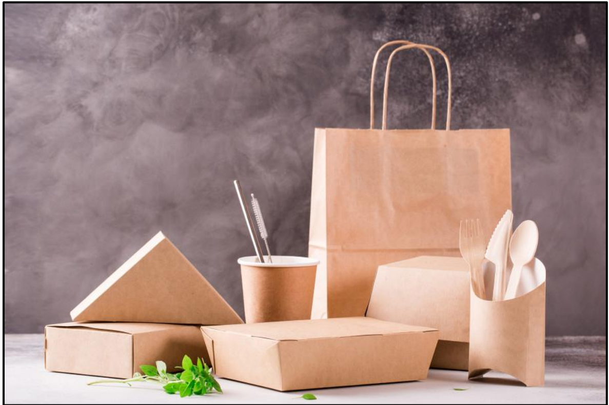
FIGUUR K: Ekovriendelike verpakking deur Viro Solutions (Suid-Afrika), 2019.

6.1.1 Bespreek waarom die verpakking in FIGUUR K ekovriendelik is. (2)