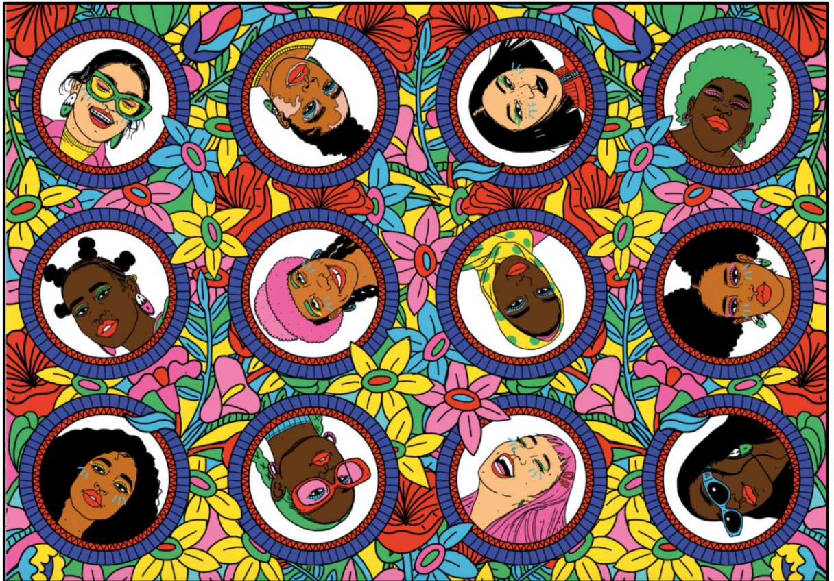
FIGUUR A: Oppervlakontwerp deur Zinhle Sithebe (Suid-Afrika), 2020.

1.1.1 Analiseer die gebruik van die volgende elemente en beginsels in FIGUUR A hierbo: