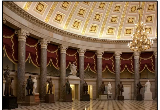
Besonderhede van die interieur van die Amerikaanse Kongresgebou .