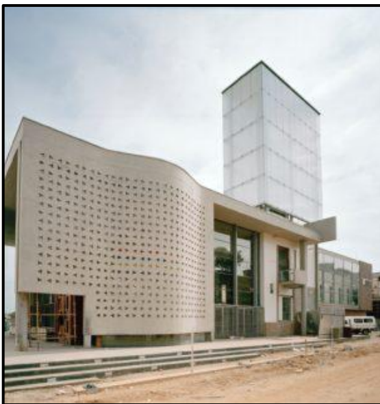
FIGUUR G: Die Konstitusionele Hof deur Urban Solutions and OMM Design Workshop (Suid-Afrika), 1996.