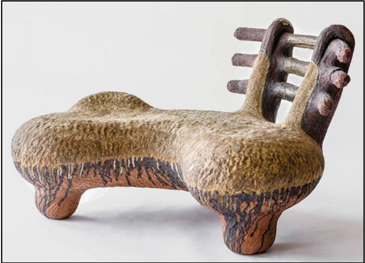
FIGUUR B: uBuhlanti (Kraal)-bank deur Andile Dyalvane (Suid-Afrika), 2020.

Analiseer die gebruik van die volgende terme ten opsigte van hulle gebruik in FIGUUR B hierbo: