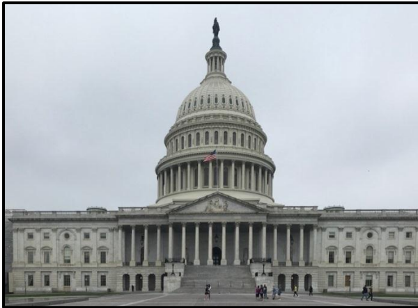
FIGUUR F: Die Amerikaanse Kongresgebou deur William Thornton (VSA), 1793–1826.