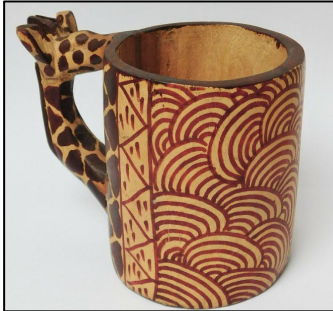
FIGUUR D: Hout-kameelperdbeker ('Wooden Giraffe mug') , ontwerper onbekend (Kenia), 2015.