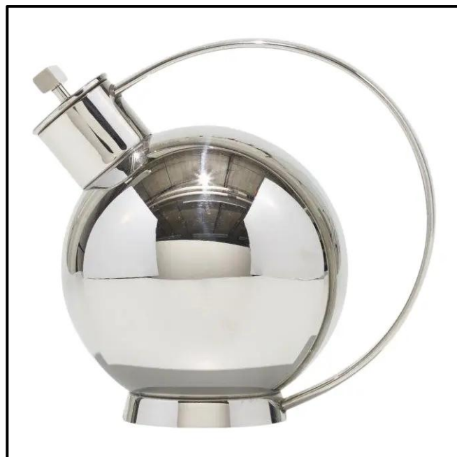
FIGUUR I: Bauhaus-mengfles deur Marianne Brandt (Duitsland), 1925.

Skryf 'n opstel (ten minste EEN bladsy) waarin jy die TWEE bekere hierbo vergelyk en verduidelik hoe hulle tipies is van die ontwerpbewegings wat hulle verteenwoordig.