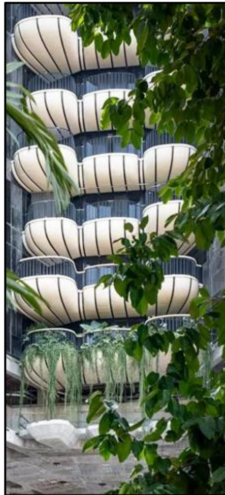
FIGUUR K: Ultraluukse toringgebou-hotel in Singapoer met organiese, kroonblaarvormige balkonne deur Heatherwick Studio (Londen), 2021.