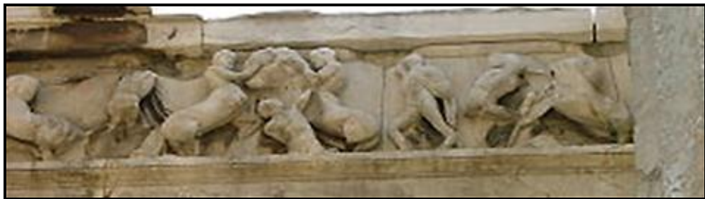
FIGUUR F: Tempel van Hephaestus deur Ictinus (Griekeland), 450 VHJ.