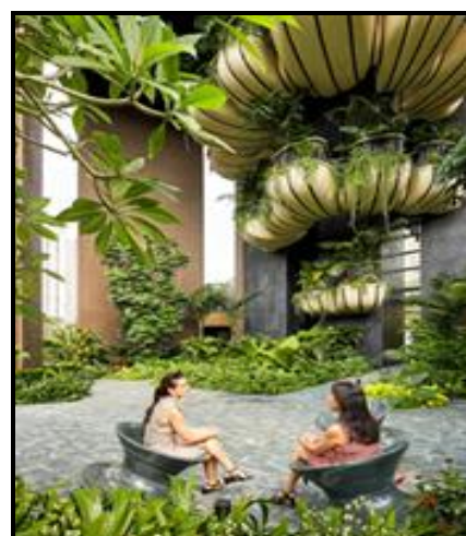
Binne- en buiteaansigte

Die interieur en eksterieur van die gebou se ontwerp in FIGUUR K werk na 'n 'groener visie' vir die toekoms wat tot voordeel van die mensdom is.