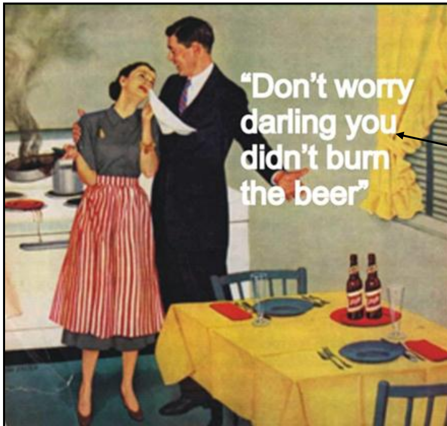
FIGUUR C: Schlitz-bieradvertensie , ontwerper onbekend (Amerika), 1950's.

Bespreek die gebruik van geslagstereotipering en vooroordeel in die plakkaat in FIGUUR C hierbo.