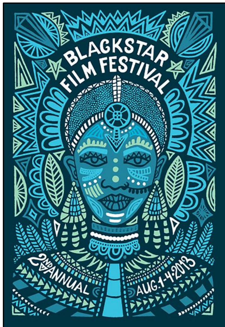
FIGUUR A: Black Star-filmfeesplakkaat ontwerp deur Andrea Pippins (VSA), 2016.

1.1.1 Analiseer die gebruik van die volgende elemente en beginsels in FIGUUR A hierbo: