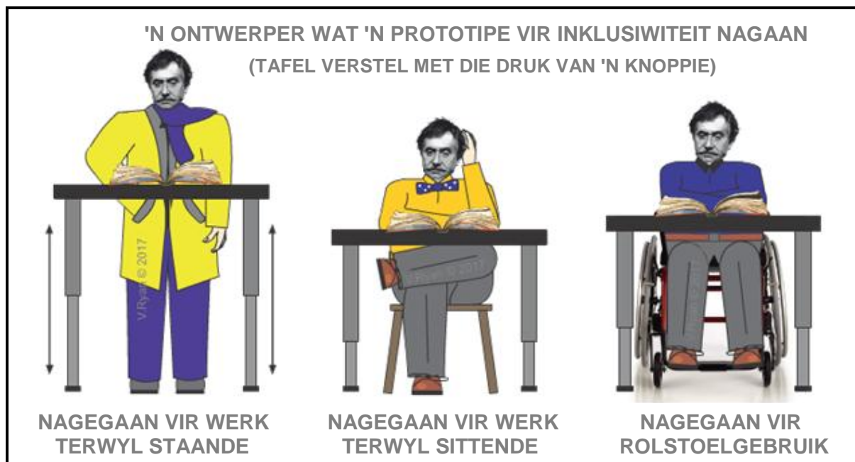
FIGUUR J: Inklusiewe Ontwerpprototipe deur V Ryan (VSA), 2017.