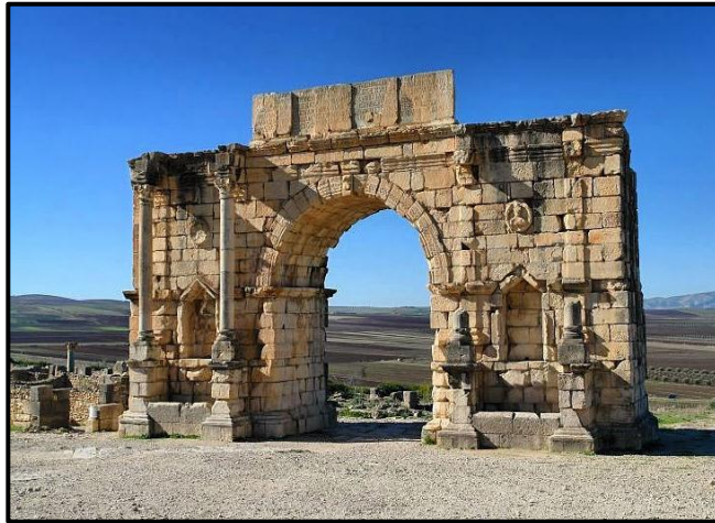
FIGUUR F: Die Boog van Caracalla , 'n antieke Romeinse stad Volubilis, in opdrag van goewerneur Marcus Aurelius Sebastenus (Marokko), 217 VHJ.