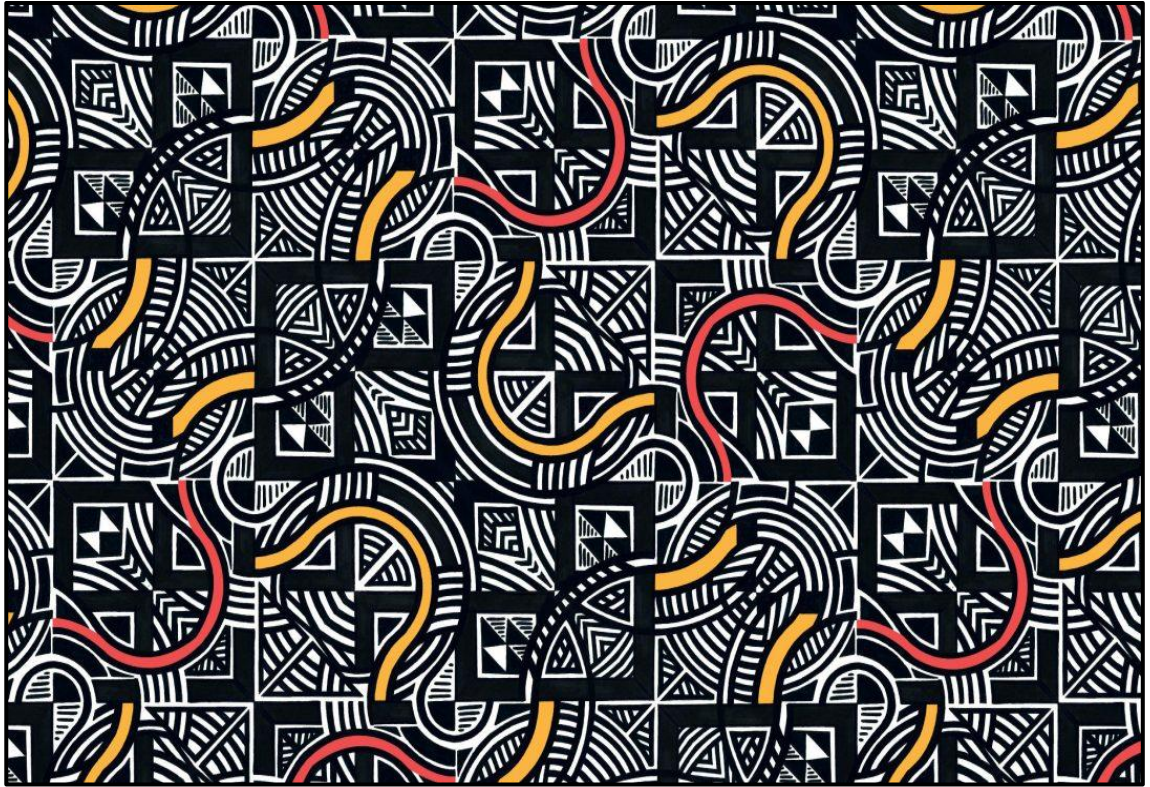
FIGUUR B: Bekroonde Patroonontwerp deur Agrippa Mncedisi Hlophe (Suid-Afrika), 2019.

1.2.1 Analiseer die gebruik van die volgende elemente en beginsels in FIGUUR B hierbo: