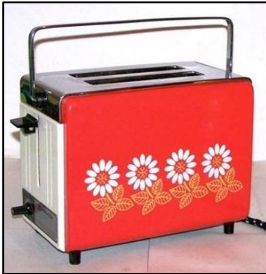
FIGUUR H: Toshiba-broodrooster (Pop-ontwerp) (Japan), 1960's.