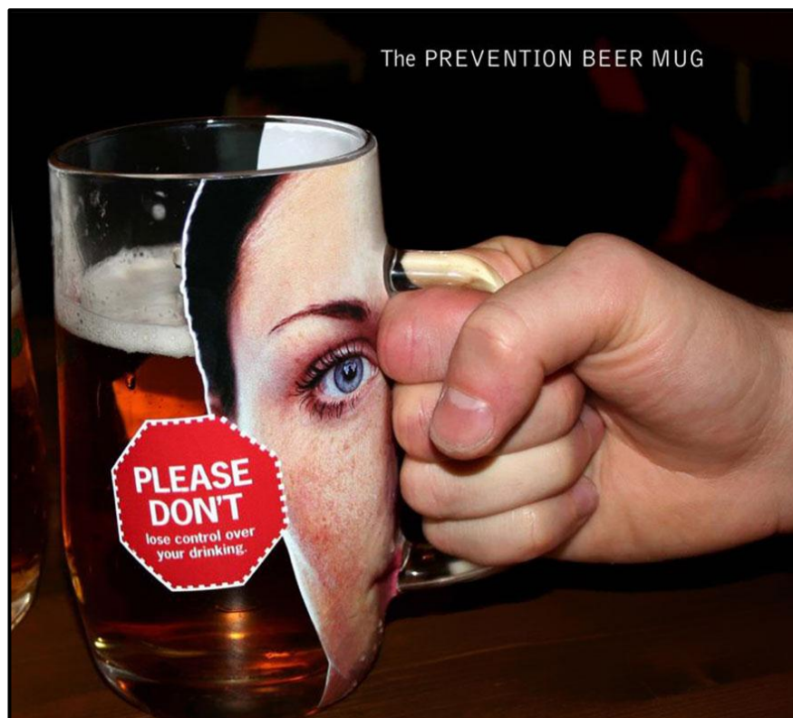
FIGUUR J: Prevention('Voorkoming')-bierbeker-plakkaat deur EURORSCG Advertising Agency (Tseggiese Republiek), 2008.