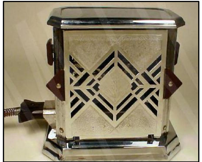
FIGUUR I: Fostoria-broodrooster vervaardig deur Bersted MFG Co (Art Deco) (VSA), 1930's.

Skryf 'n opstel (ten minste EEN bladsy) waarin jy die broodrooster in FIGUUR H met die broodrooster in FIGUUR I hierbo vergelyk. Verduidelik hoe die broodroosters tipies is van die bewegings waartoe hulle behoort.