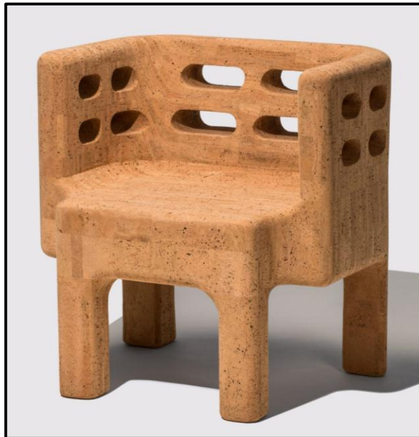
FIGUUR L: Stoel uit die Sobreiro-versameling deur die Campana Brothers (Brasilië), 2018. Die stoel is van kurk gemaak.

(Kurk is 'n materiaal wat uit die bas van die kurkeikeboom verkry word. Die bas word van die boom, wat nooit afgekap word nie, afgestroop om die kurk te oes. Kurk is omgewingsvriendelik, waterbestand en kan dryf.)