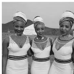
Iqhiya of kopserp of 'doek'

Die iqhiya of kopdoek is tradisioneel deur getroude vrouens gedra en om die uitrusting af te rond, is geborduurde mantels of komberse om die skouers gedra. Die serp is bedoel om die vrouefiguur weg te steek sowel as om haar vrugbaarheid te beskerm, terwyl die 'doek' 'n teken van respek vir die ouderlinge was; 'n nuwe bruid mag nie sonder 'n doek met die ouderlinge praat nie.☑