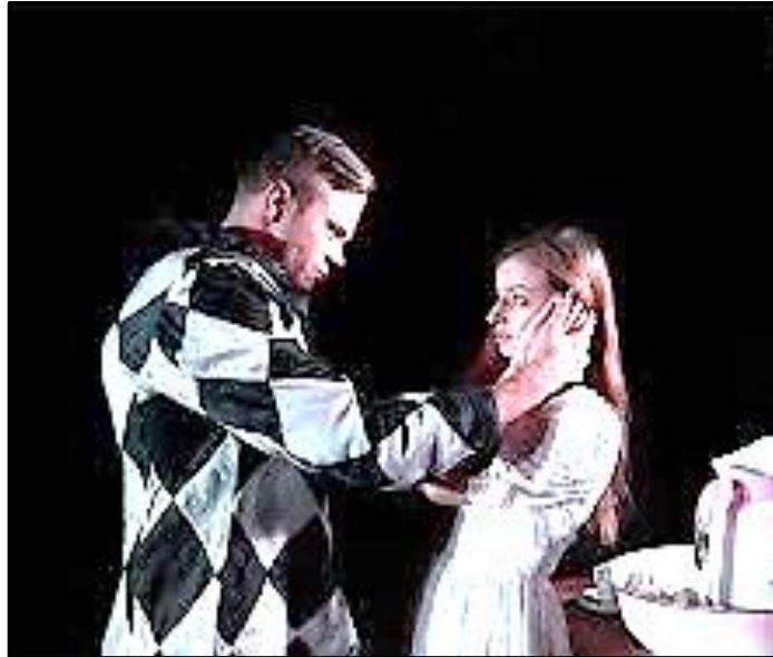
[Bron: 'n Produksie van Mis deur André Stolz]

Bestudeer BRON O hieronder en beantwoord die vrae wat volg.