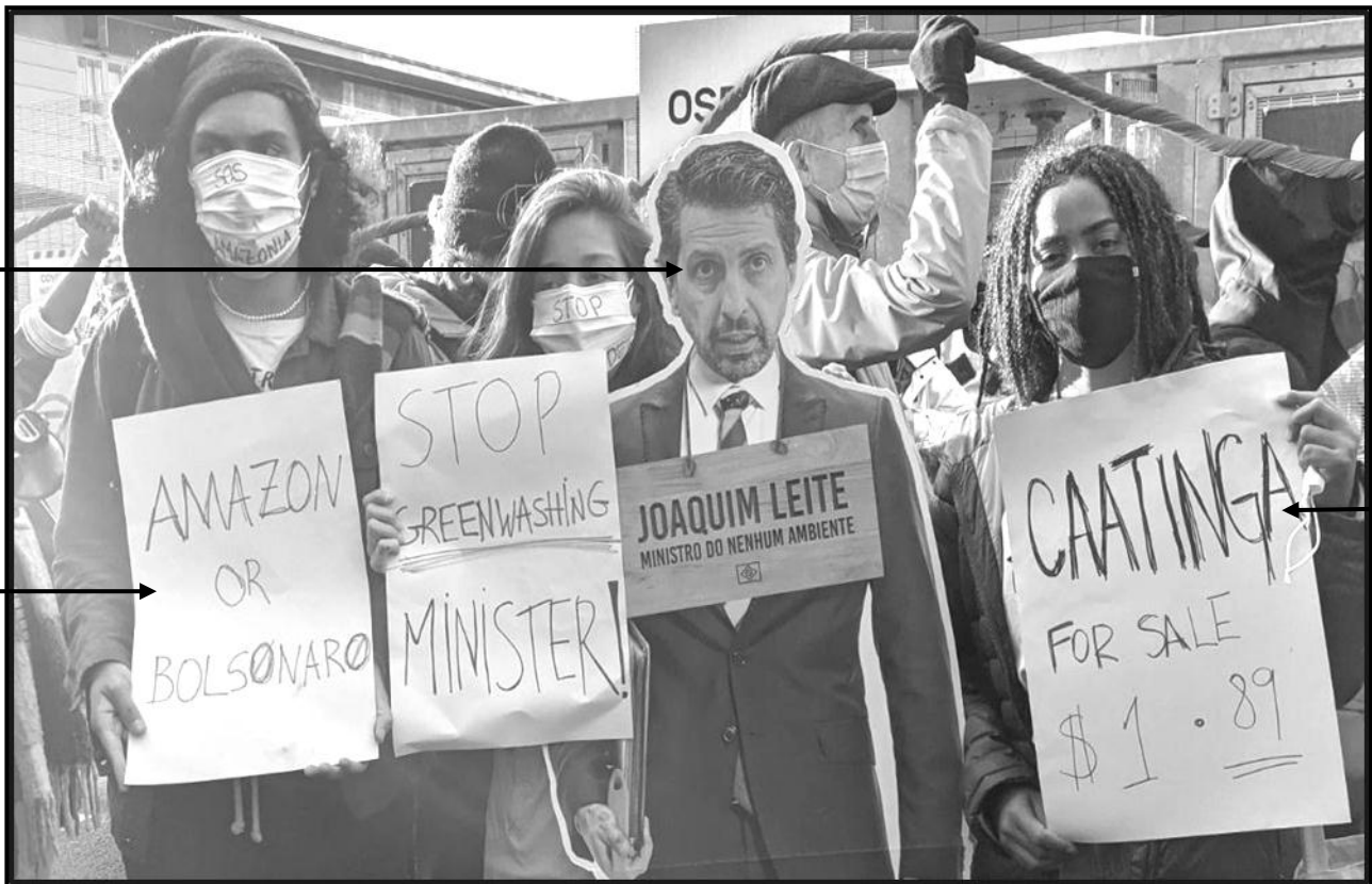
[Uit The Times , 12 November 2021]