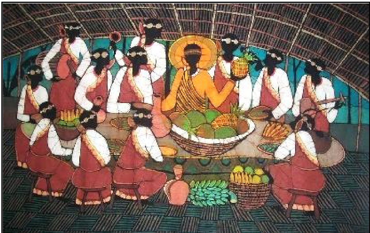
FIGUUR 4b: Dominic Lukandwa, The Last Supper (Die Laaste Avondmaal) , batik op sy, datum onbekend.