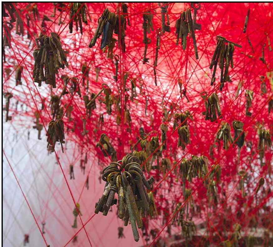
FIGUUR 5b: Chiharu Shiota, The Key in the Hand (Die Sleutel in die Hand) (detail), installasie met bote, wol/drade en sleutels, 2015.