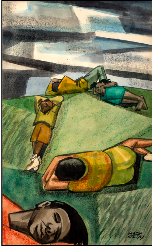
FIGUUR 1a: Peter Clarke, Sleepers on the Grass ( Slapers op die Gras ), waterverf, 1967.