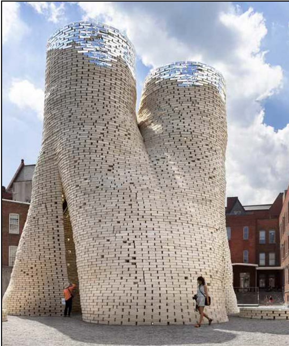
FIGUUR 8: 15 de uitgawe van YAP ('Young Architects Program'), Hy-Fi . Die tydelike struktuur sal gebou word met 3M weerklaatsende, bio-ontwerpte organiese bakstene, van mieliebronke en lewendige wortelstrukture gemaak. Die bakstene sal as saadkissies gebruik word voordat dit in die struktuur gebruik sal word. Long Island City, 2014.