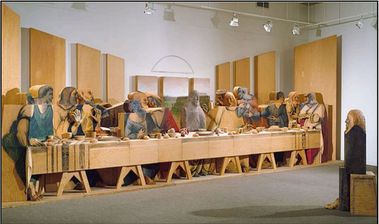
FIGUUR 4a: Marisol Escobar, Self-Portrait Looking at The Last Supper (Selfportret Beskou Die Laaste Avondmaal) , laaghout, bruinsteen, gips en aluminium, 1982–1984.