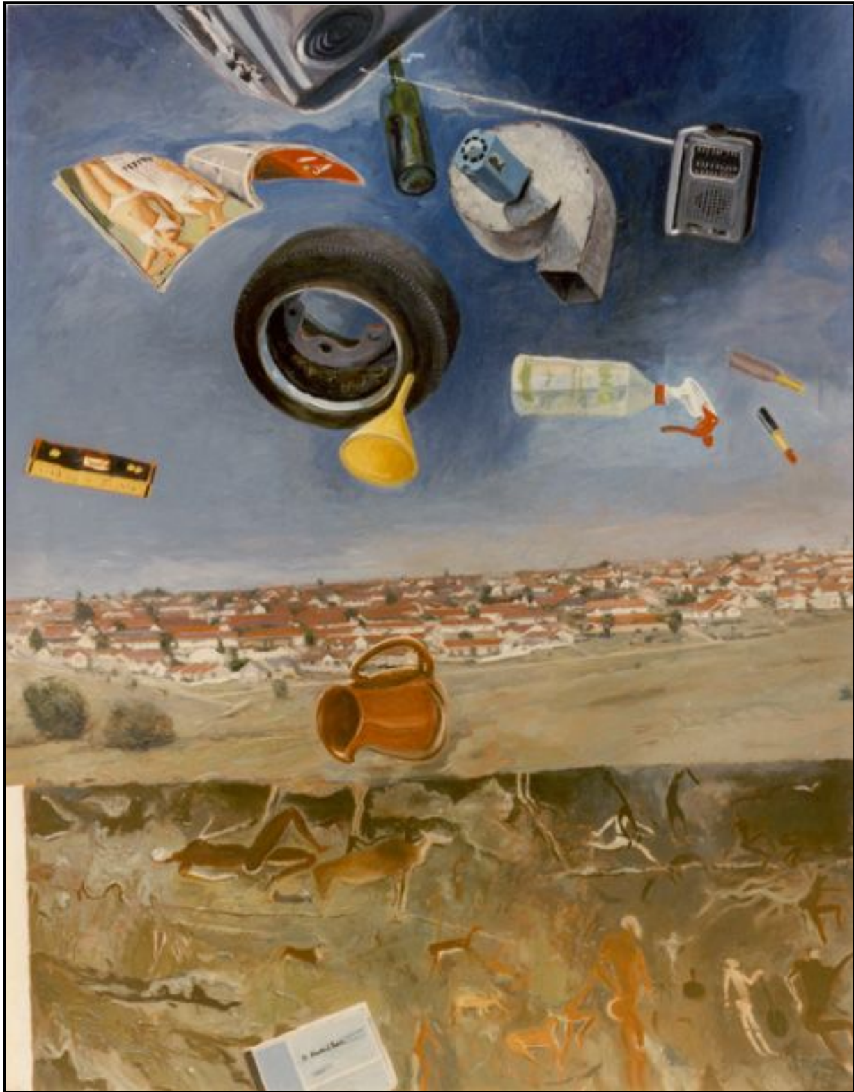
FIGUUR 2: Simon Stone, Domestic Rain (Huishoudelijke Reënval) , olieverf op doek, 1982.