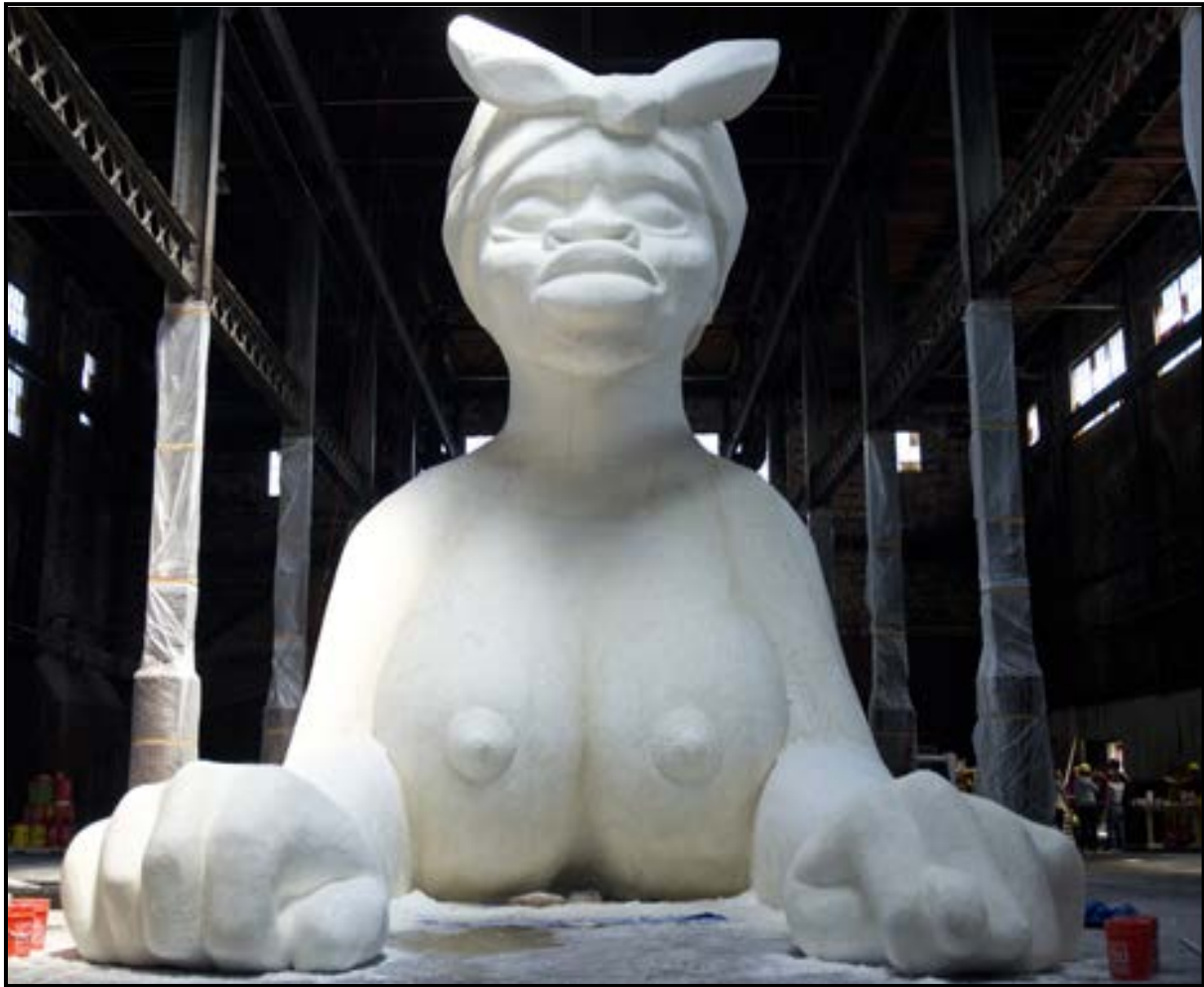
FIGUUR 7a: Kara Walker, A Subtlety, or the Marvelous Sugar Baby ('n Subtiliteit, of die Wonderlike Suikerbaba ), polistireen, melasse en suiker, 2014.