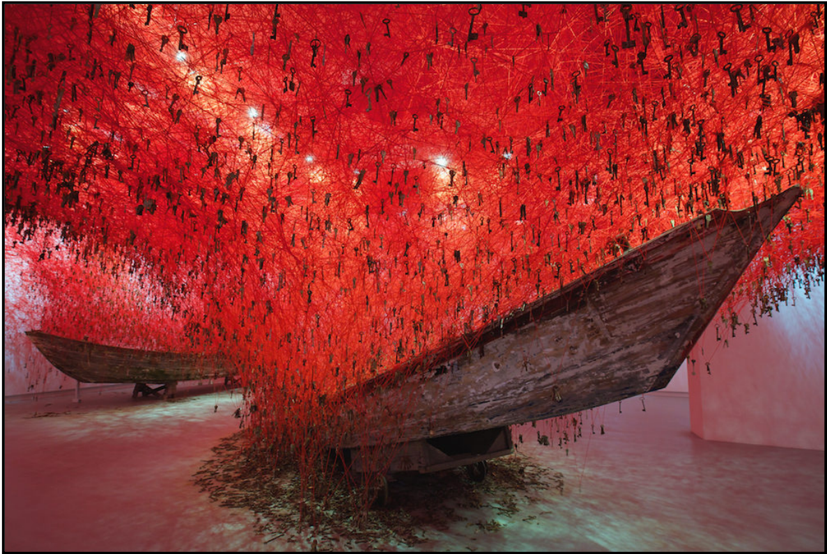
FIGUUR 5a: Chiharu Shiota, The Key in the Hand (Die Sleutel in die Hand) , installasie met bote, wol/drade en sleutels, 2015.