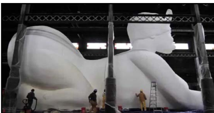
FIGUUR 7b: Kara Walker, syaansig van A Subtlety, or the Marvelous Sugar Baby ('n Subtiliteit, of die Wonderlike Suikerbaba ), polistireen, melasse en suiker, 2014.