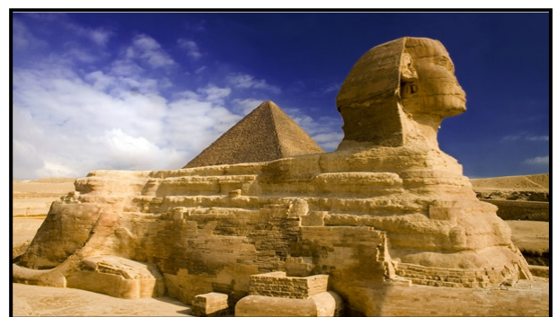
FIGUUR 7c: Sfinks van Giza , kalksteenbeeld, gebou gedurende die heerskappy van Faraο Khafra (c. 2558–2532 v.C.), Egipte.