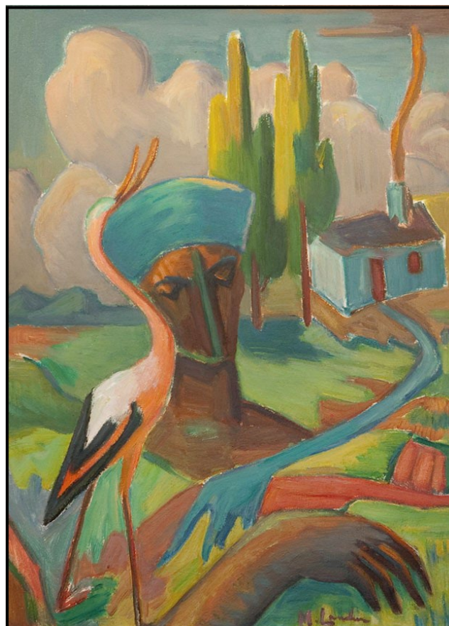
FIGUUR 2b: Maggie Laubser, Bird, head and house in a landscape (Voël, kop en huis in 'n landskap) , olieverf op bord, 1957.