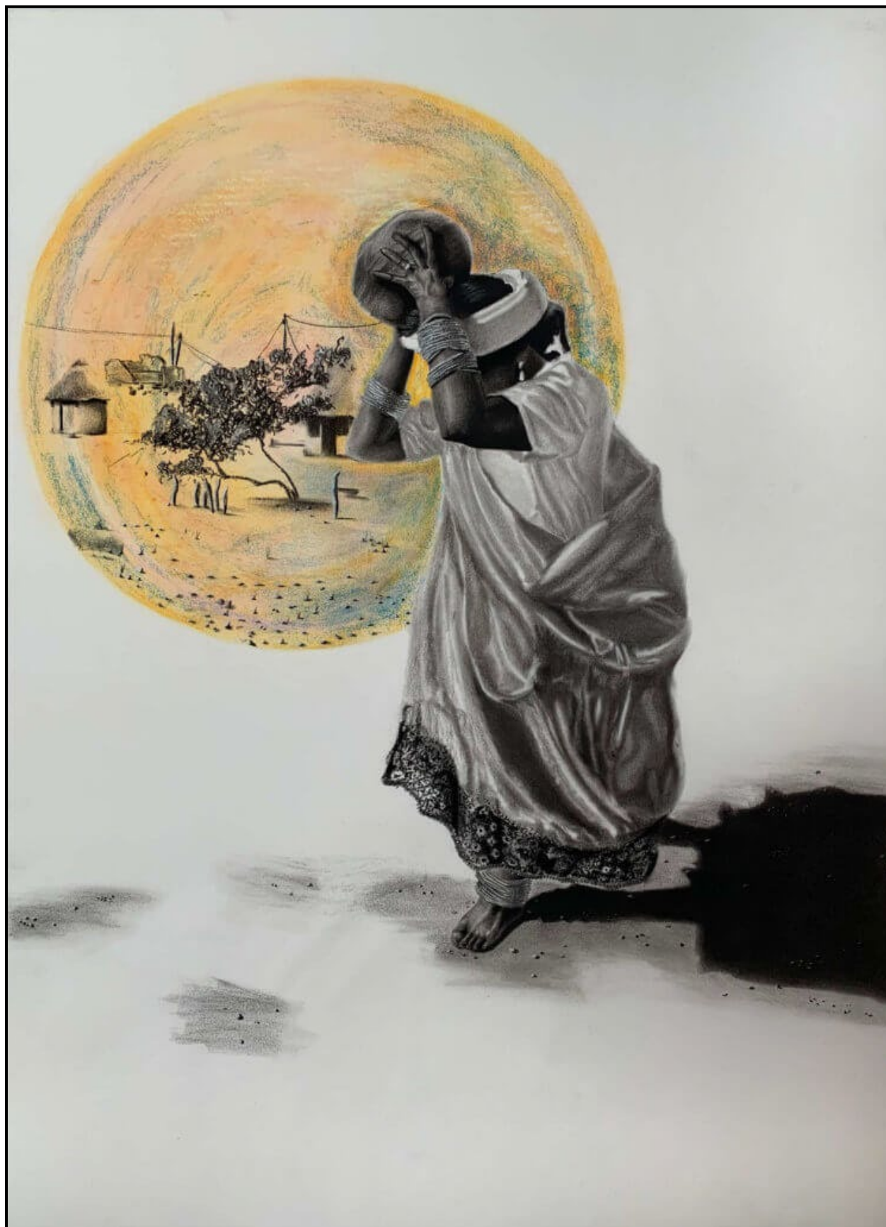
FIGUUR 4a: Moshe Chauke, Bomba Ra Xintu ('Pride of Heritage') (Trots op Erfenis) , houtskool en pastel, 2019.