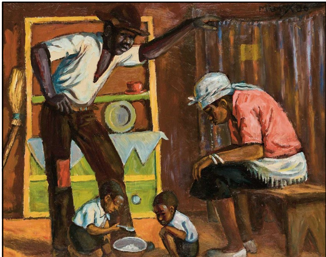
FIGUUR 1b: George Pemba, Unemployed (Werkloos) , olieverf op bord, 1986.