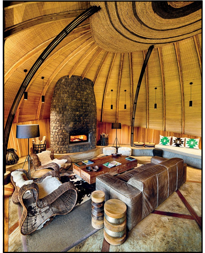
FIGUUR 8a en 8b: Nick Plewman Argitekte, Rwanda Lodge, Rwanda Wilderness (Wildernis) Bisate (Africa), 2018.