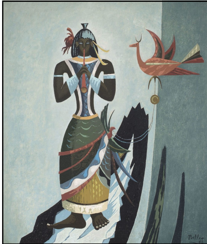
FIGUUR 2a: Alexis Preller, Herdboy (Veewagter) (Seun met Fluit) , olieverf op doek, 1962.