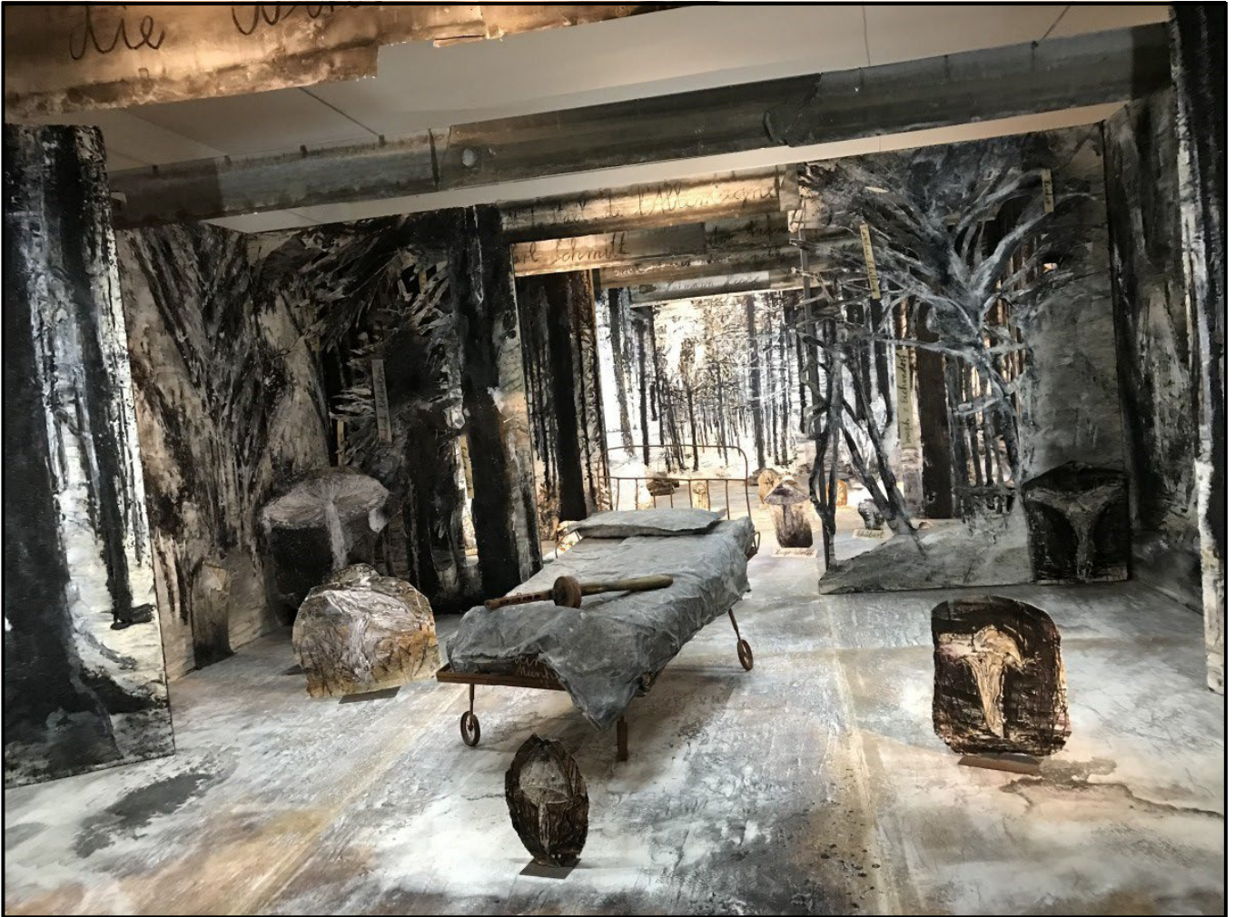
FIGUUR 5a: Anselm Kiefer, Winterreise ('Winter Journey') , installasie, emulsie, olie, akriel, skellak, houtskool op doek en hout met loodvoorwerpe, metaal, hars, hout, verbrande boeke en karton, 2015–2020.