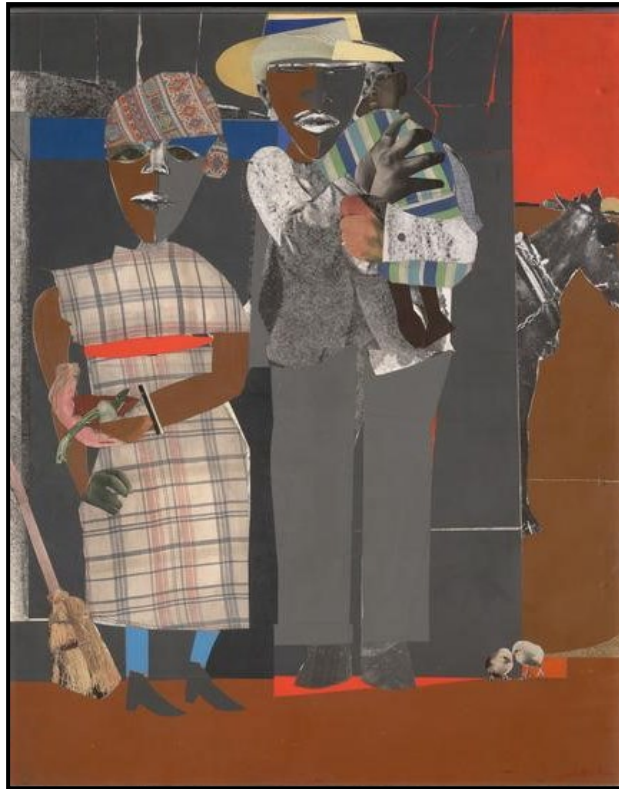
FIGUUR 6a: Romare Bearden, Continuities (Aaneenlopendheid) , collage op bord, 1969.

Aaneenlopendheid ('Continuities'): Ononderbroke of konsekwente bestaan met verloop van tyd