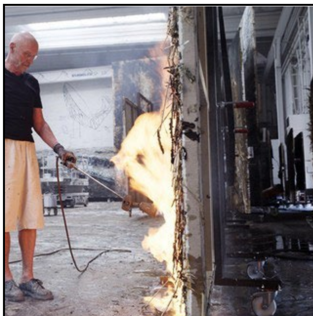
FIGUUR 5b: Anselm Kiefer besig om in sy ateljee te werk.