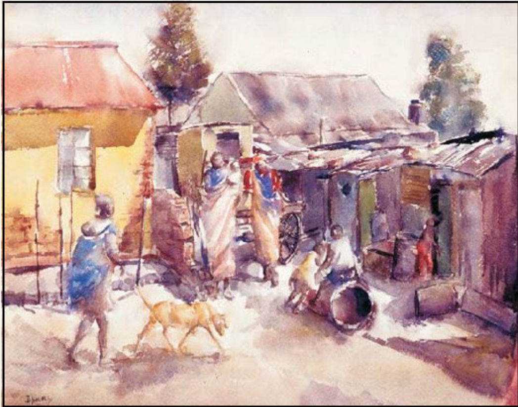
FIGUUR 1a: Durant Sihlali, Primville location (Primville-lokasie) , waterverfskildery, 1971.