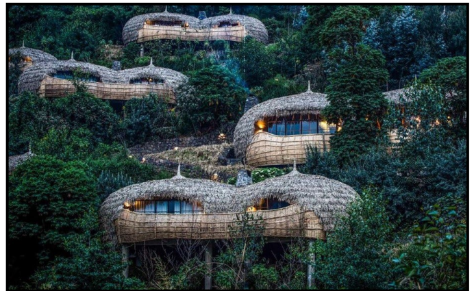
FIGUUR 8c en 8d: Nick Plewman Argitekte, Rwanda Lodge, Rwanda Wilderness (Wildernis) Bisate , ses ruim, voëlnesagtige villas rus op ruie plantegroei, datum onbekend.

Bisate: Dit beteken 'stukke' in Kinyarwanda, wat na 'n vulkaan se natuurlike erosie verwys.