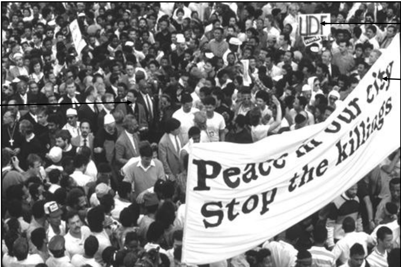
[Uit Images of Defiance: South African Resistance Posters of the 1980s ]

Die foto hieronder (fotograaf onbekend) is op 13 September 1989 geneem. Dit toon 'n gedeelte van die skare wat aan die vredesoptog deelgeneem het wat deur die Mass Democratic Movement (MDM) georganiseer is, met Allan Boesak, een van hulle leiers, sigbaar.