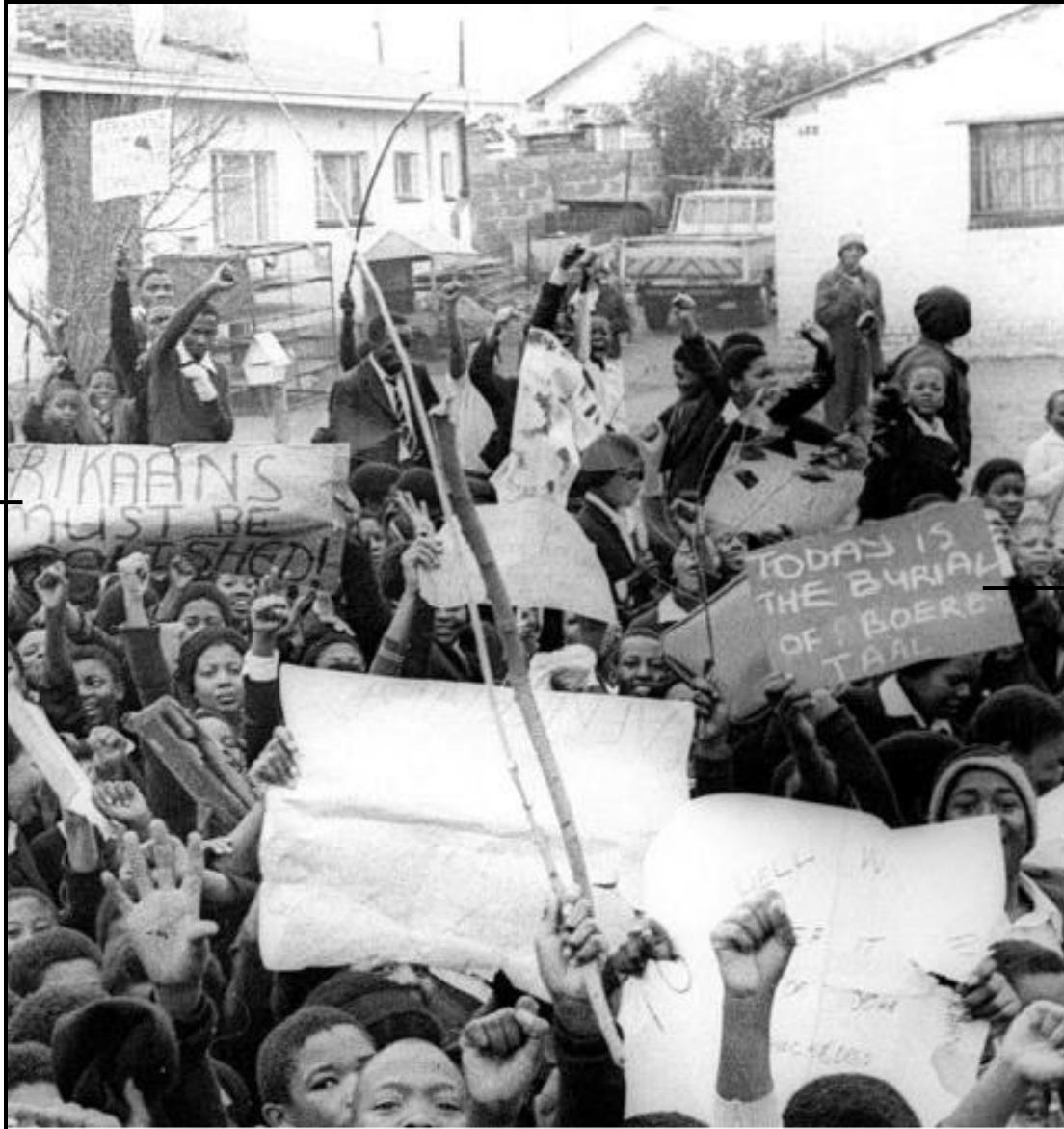
[Uit http://www.google.com/history/africamediaonline.com/exhibit/Soweto-riots/gRZOEihk?hl=en . Toegang op 14 Februarie 2016 verkry.]

Die foto hieronder toon lede van die Suid-Afrikaanse Studente-organisasie (SASO) wat op 16 Junie 1976 in Soweto teen die gebruik van Afrikaans as onderrigtaal betoog het.